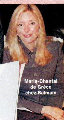
Marie-Chantal de Grèce chez Balmain