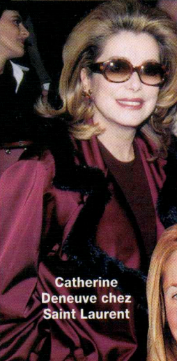
Catherine Deneuve chez Saint Laurent