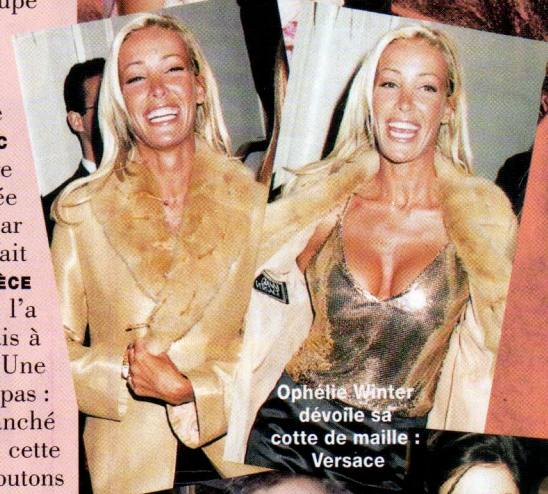
Ophélie Winter dévoile sa cotte de maille : Versace