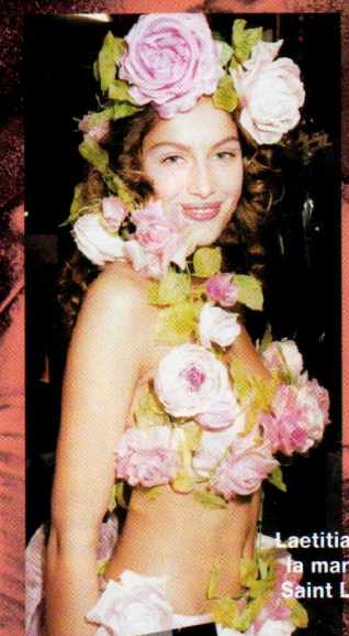
Laetitia Casta, la mariée de Saint Laurent