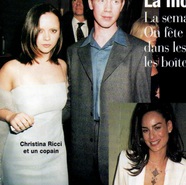
Christina Ricci et un copain